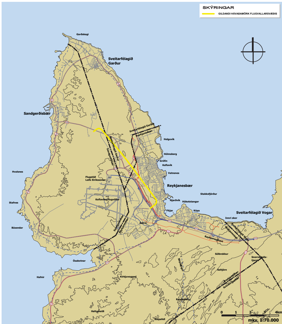
SKV. NÚGILDANDI SVÆÐISSKIPULAGI: SVÆÐISSKIPULAG - REYKJANESBÆR, SANDGERÐISBÆR, GERÐAHREPPUR, KEFLAVÍKURFLUGVÖLLUR 1995-2015